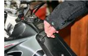
RETIRER LES VIS DE FIXATION SUPERIEURES DES FLANS DROIT ET GAUCHE SUR LE RESERVOIR.