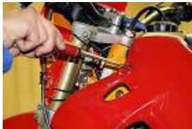
DEPOSE DU FLAN DE CARENAGE DROIT.