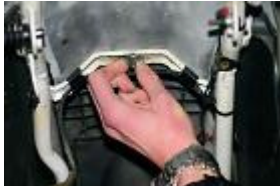
RETIRER LE PAPILLON SOUS LA SELLE.