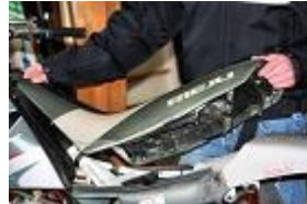
RETIRER LA SELLE.