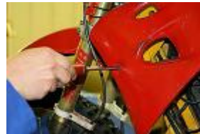
RETIRER LA BOBINE HAUTE TENSION EN DEBRANCHANT TOUS LES CABLES.